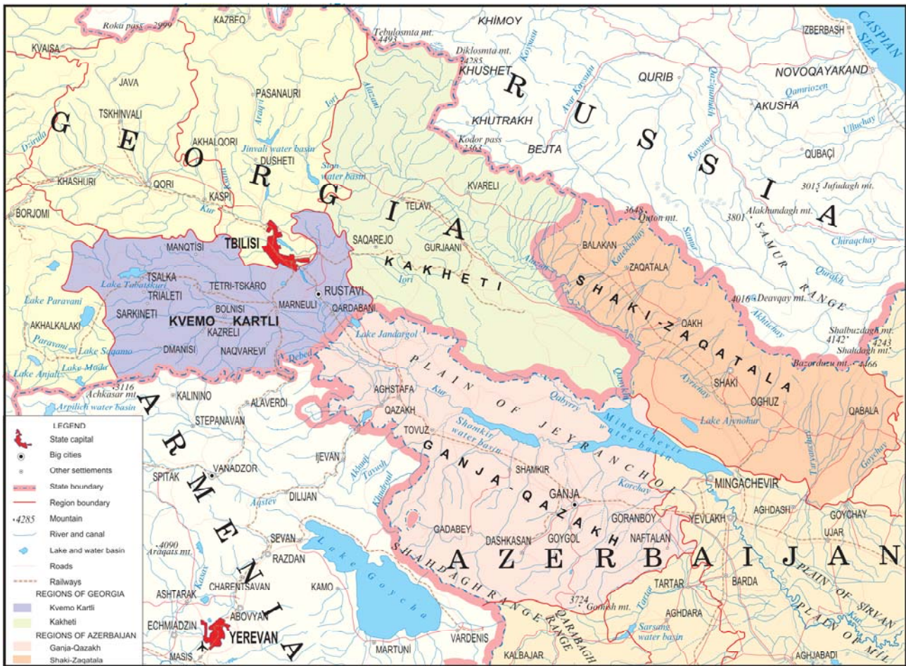
დანართი 1: შესაბამისი ტერიტორიის რუკა