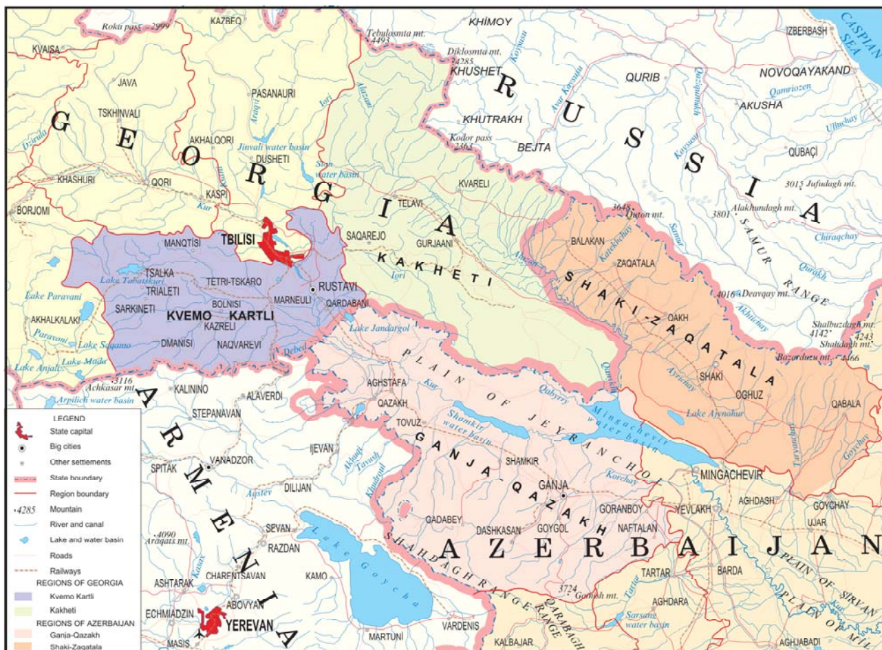
Əlavə 1: Hədəf ərazinin xəritəsi